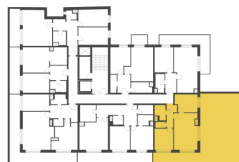
Schéma půdorysu představuje dispoziční řešení bytu. Zobrazené vybavení nábytkem, vestavěné skříně, kuchyňská linka včetně spotřebičů a pračky nejsou součástí dodávky bytu. Toto vybavení je zobrazeno pouze pro názornost. Celková podlahová plocha je vypočtena dle nařízení vlády č. 366/2013 Sb. Veškeré informace jakkoliv publikované v tomto dokumentu jsou nezávazné marketingové informace obecné povahy, které nelze vykládat jako nabídku na uzavření smlouvy ani se jich nelze dovolávat.

+420 226 292 876 info@homeportal.cz www.homeportal.cz